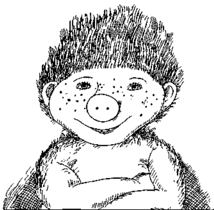
Acesta este Sambo